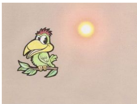
Photo du soleil - lundi 16 octobre 2017.

Non, la carrière n'est pas ouverte... c'est une livraison "spéciale" (par air) du sable du Sahara ! Pour vous donner une idée : Laâyoune (une ville du Sahara Occidental) se trouve à 2 484 km de Cruguel à vol d'oiseau.